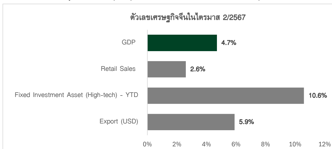
รูปที่2: การลงทุนในอุตสาหกรรม High-tech และการส่งออกหุ่นเศรษฐกิจจีน